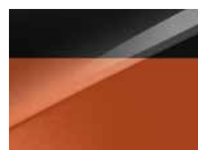
Pearl black & Orange fusion (HBB)