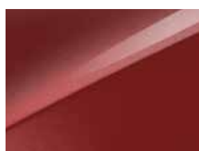
Infra red (AA9)