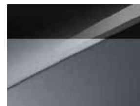
Pearl black & Lunar silver (HA5)