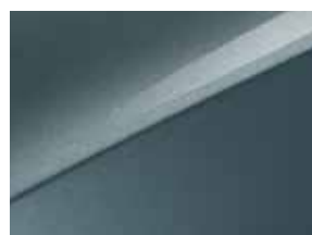
Yucca steel gray (USG)