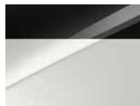
Pearl black & Deluxe white (HA2)