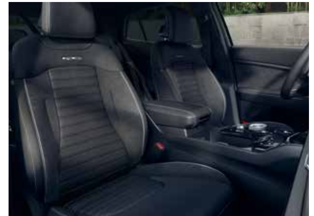
GT-PlusLine Premium suède/kunstleder, zwart. Voor nog meer luxe, upgrade naar het zwart kunstlederen stoelen met gewatteerd ontwerp over de breedte van het zitkussen en de rugleuning samen met een combinatie van suède kussens. Met contrasterende witte stiksels en witte biezen plus een GT-Line logo in reliëf. Portierbekleding in soft-touch, suède binnenpanelen, suède/kunstlederen bekleding op de armleuningen en zwarte hemelbekleding maken dit interieur compleet.