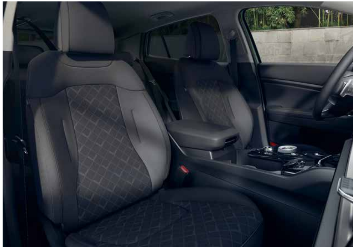
Sportage ComfortLine: zwart stof "standaard". De Sportage ComfortLine-uitvoering heeft standaard zwarte stoffen stoelbekleding met zwarte stiksels en hemelbekleding in stijlvol grijs.

In het interieur van de Sportage is alles erop gericht om jou je perfect thuis te laten voelen. In elke uitvoering is uitsluitend gebruik gemaakt van hoogwaardige materialen die prettig aanvoelen en jarenlang mooi blijven. Van de mooiste geweven stoffen en duurzaam kunstleder tot diverse kwaliteiten suède. In de Sportage GT-Line uiteraard inclusief prachtig gepreegd GT-Line logo.