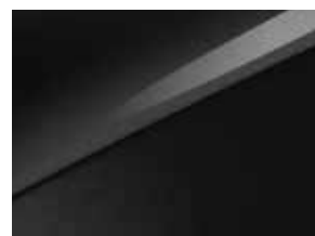
Pearl black (1K)