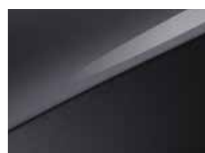
Penta metal (H8G)