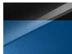
Pearl black & Blue flame (HA8)