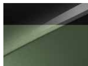
Pearl black & Experience green (HBC)