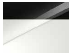
Pearl black & Casa white (HA3)