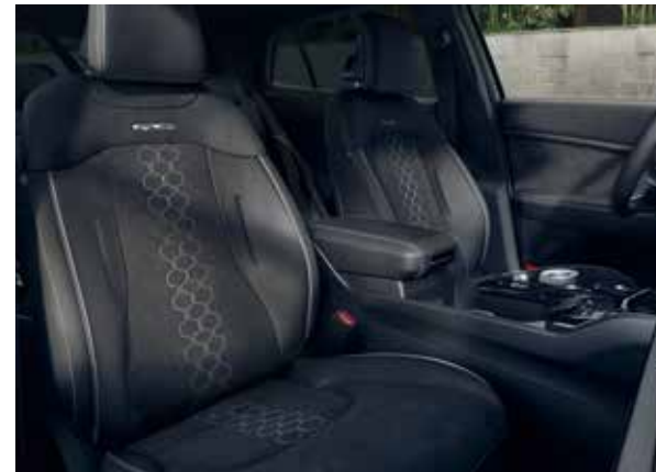
GT-Line suède/kunstleder, zwart. Zwarte suède zitting met gewatteerde middenbaan. De combinatie van kunstleder is afgewerkt met stijlvolle contrasterende witte stiksels en witte biezen en een gepreegd GT-Line logo. Portierbekleding in soft-touch, suède binnenpanelen, suède/kunstlederen bekleding op de armleuningen en chicke zwarte hemelbekleding maken dit interieur compleet.

De stoelen met zwarte stof en kunstlederen bekleding zijn voorzien van stijlvolle zwarte stiksels. Geleverd met soft-touch portierbekleding, kunstlederen armleuningen, kunstlederen portierpanelen en hemelbekleding in stijlvol grijs.