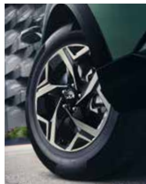
17" lichtmetalen velgen. ComfortLine.

Elke Sportage is tot in het kleinste detail geperfectioneerd. Daar horen hoogwaardige, sportieve en oogstrelend mooie lichtmetalen velgen bij. Maak jouw keuze uit deze prachtige designs in 17" tot 19".