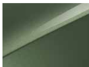
Experience green (EXG)