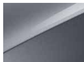
Lunar silver (CSS)