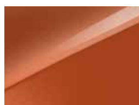
Orange fusion (RNG)