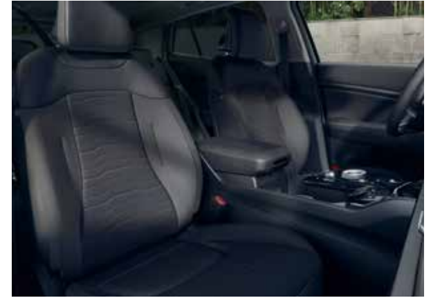
Sportage DynamicPlusLine: zwart stof/kunstleder.

De Sportage DynamicLine-uitvoering heeft een luxe zwarte stoffen stoelbekleding met zwarte stiksels en hemelbekleding in stijlvol grijs.