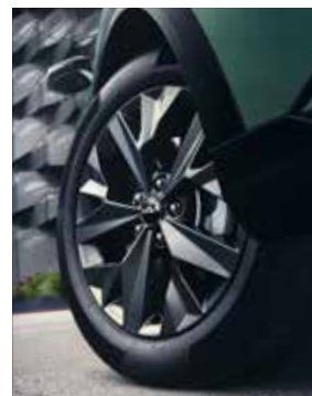
18" lichtmetalen GT-Line velgen. GT-Line/GT-PlusLine.