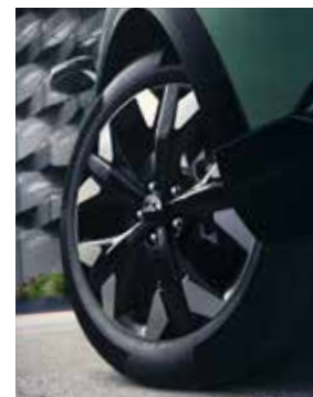
19" lichtmetalen velgen. Alleen voor Plug-in Hybrid DynamicLine/DynamicPlusLine.