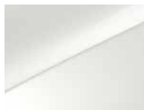
Casa white (WD)