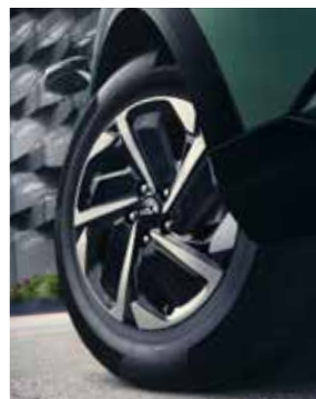
17" aerodynamische lichtmetalen velgen. DynamicLine.