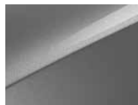
Sparkling silver (KCS)