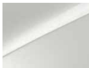
Deluxe white (HW2)