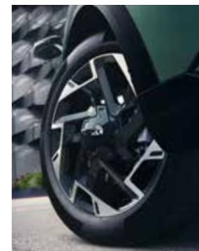
19" lichtmetalen GT-Line velgen. Alleen voor Plug-in Hybrid GT-Line/GT-PlusLine.