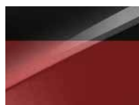
Pearl black & Infra red (HA7)