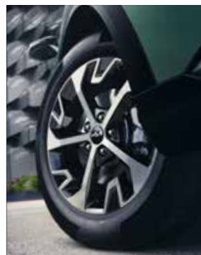
18" lichtmetalen velgen. DynamicPlusLine.